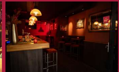
'T GILDEHUYS Café Dam 4, Zaandam