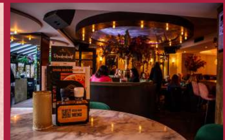
MAIL COMPANY Grand Café Dam 7B, Zaandam