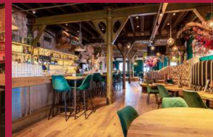
BATAVIA 1894 Grand Café Veerdijk 39, Wormer