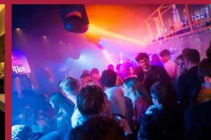
BONTE HEN Partycafé Dam 6, Zaandam