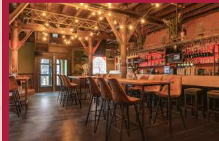
BATAVIA BAR Dance & Events Veerdijk 39B, Wormer