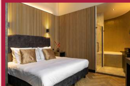
MONUMENT HOTEL ★★★★ Hotel Dam 7C, Zaandam